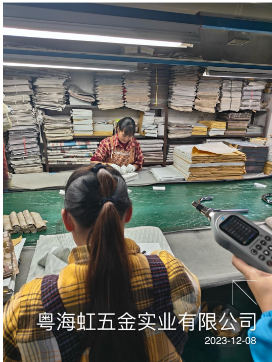
粤海虹五金实业有限公司