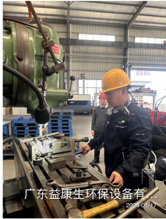
广东益康生环保设备有...