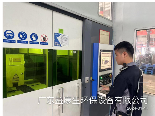
广东益康生环保设备有限公司